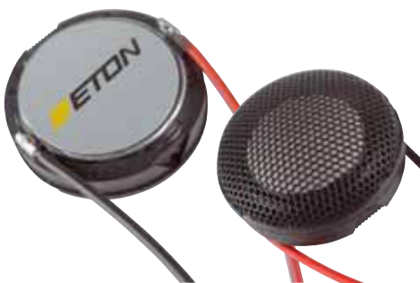
Der neue Eton-Hochtöner wartet mit einer Premiere auf: Erstmals gibt es Aluminium-Keramik