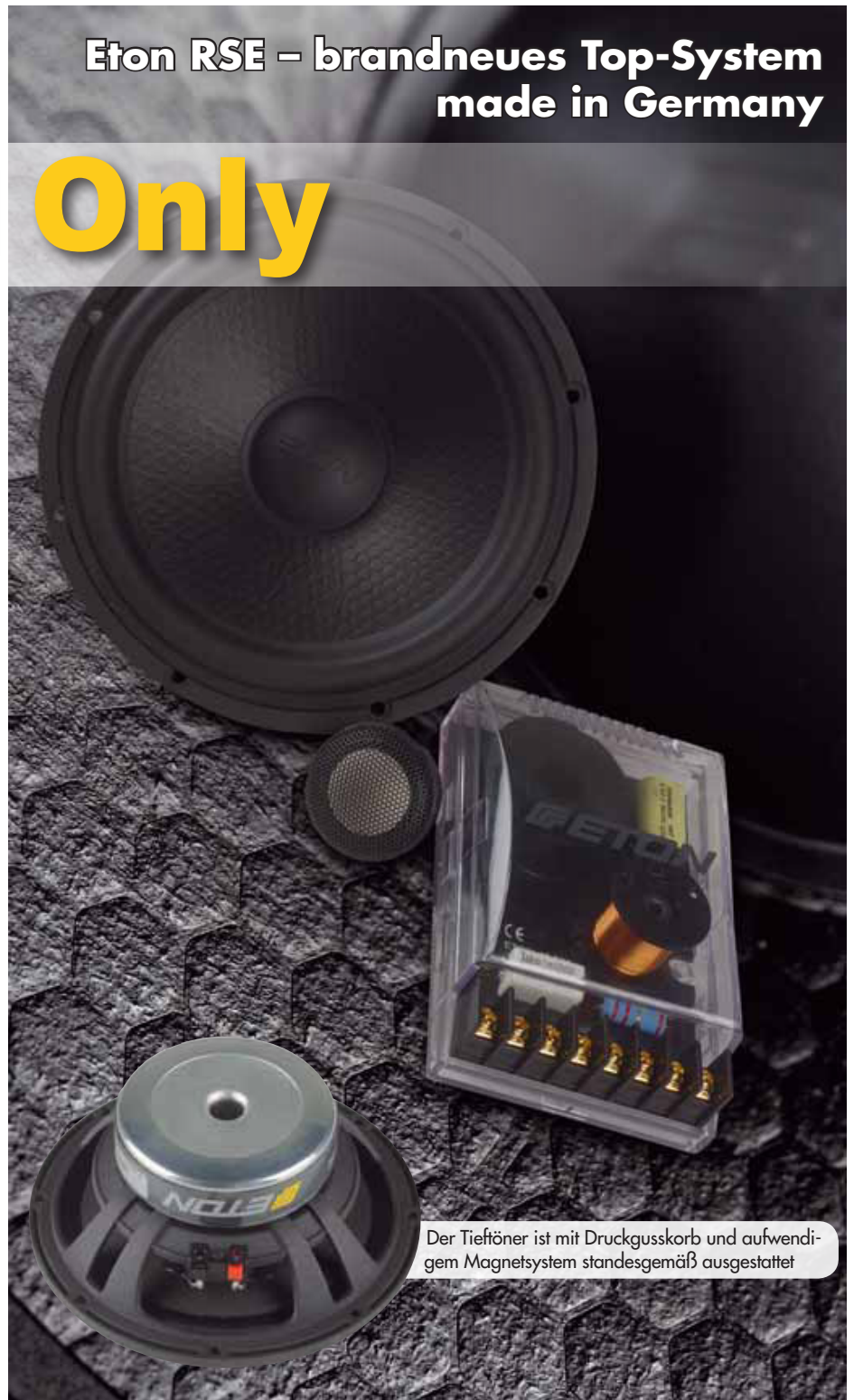
Der Tieftöner ist mit Druckgusskorb und aufwendigem Magnetsystem standesgemäß ausgestattet

Eton RSE – brandneues Top-System made in Germany